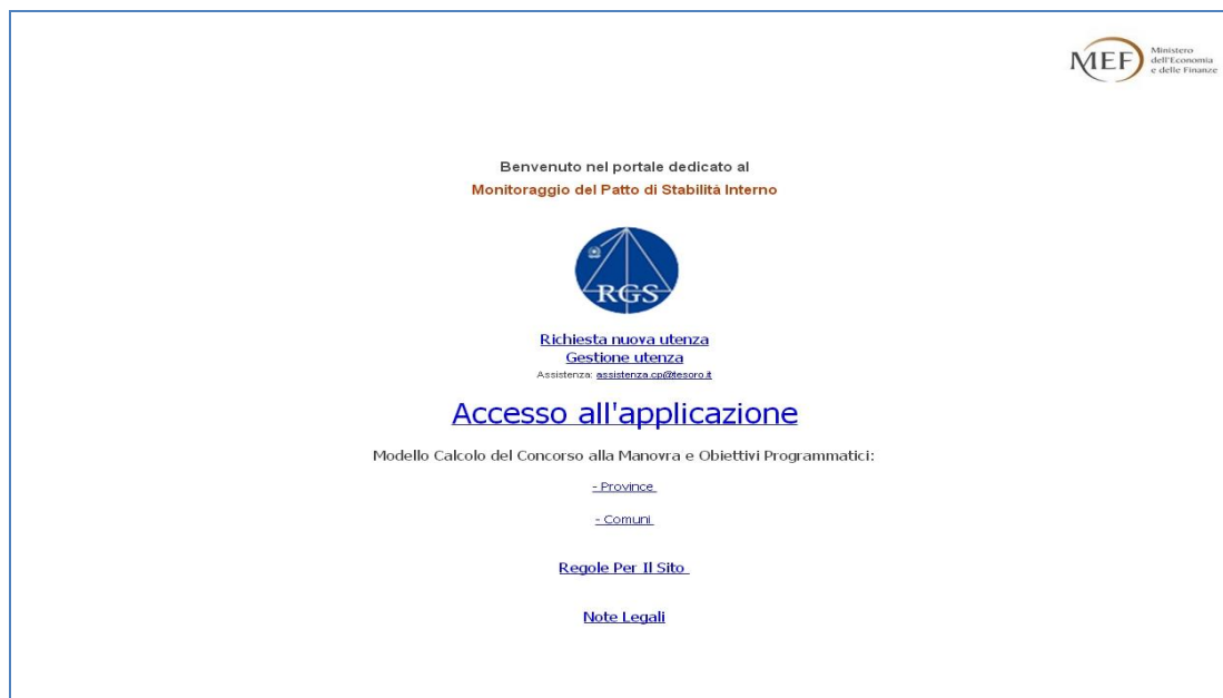
Figura 1: pagina iniziale

Gli enti che ancora non hanno un'utenza per accedere al "Patto di Stabilità", possono inviare la richiesta in questione direttamente dal sito: http://pattostabilitainterno.tesoro.it cliccando sul link Richiesta Nuova Utenza .